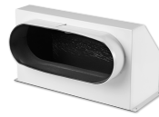
LULH 315 o