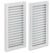
FMS M5-2 ZUL Inverter