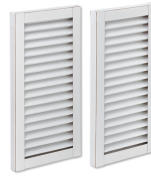
FMS F7-2 ZUL Inverter