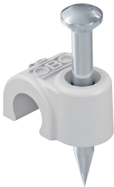
ISO-Nagel Clip, Kurze Bauform